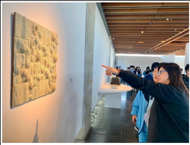
參觀 2023-2024 陶瓷雙年展