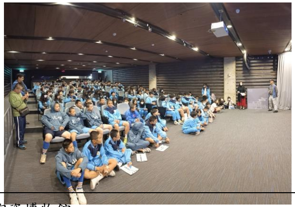
參訪新北市立陶瓷博物館