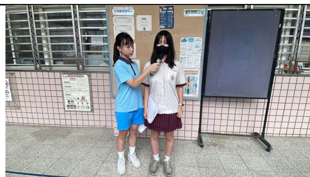
說明：朝會布農族語演說