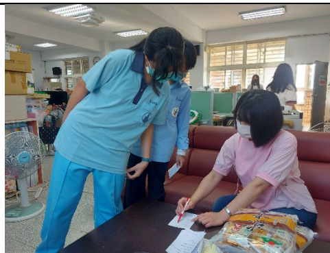
說明：世界母語日-「母語有你(禮)會更好」相關活動