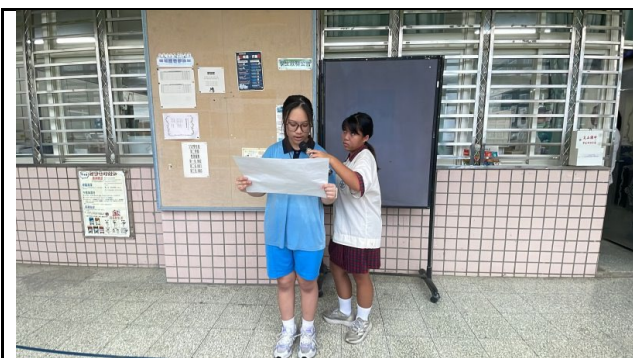
說明：朝會客語朗誦文章