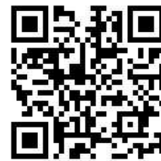
新北市政府教育局新媒體 QR code